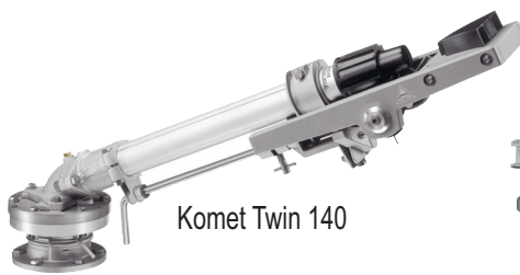
Komet Twin 140