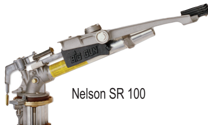
Nelson SR 100