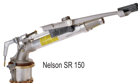
Nelson SR 150