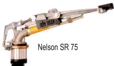
Nelson SR 75