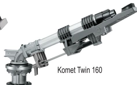
Komet Twin 160