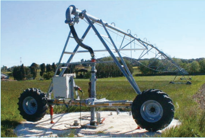
EL SPEEDY MULTICENTRO