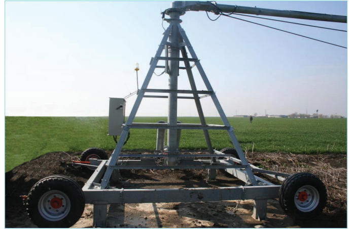
PIVOTE DESPLAZABLE SOBRE RUEDAS