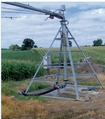
PIVOTE DESPLAZABLE SOBRE ESQUÍ

Los desplazamientos de una postura a la otra se hacen con la ayuda de un tractor (las ruedas de los tramos puestas en posición transporte).