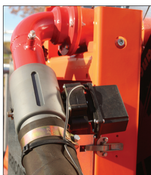
Válvula de regulación controlada con motor eléctrico