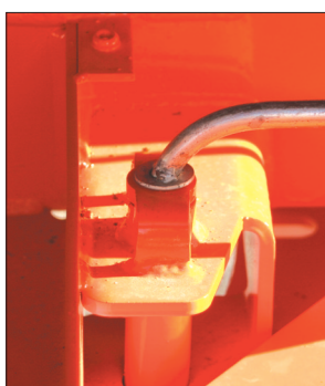
Rotación tornamesa manual con enganche automático