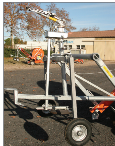
Levantamiento automático del trineo en fin de enrollamiento