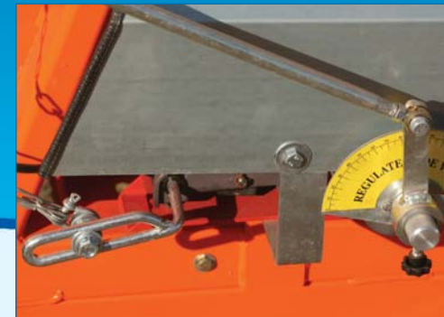
Régulation de vitesse