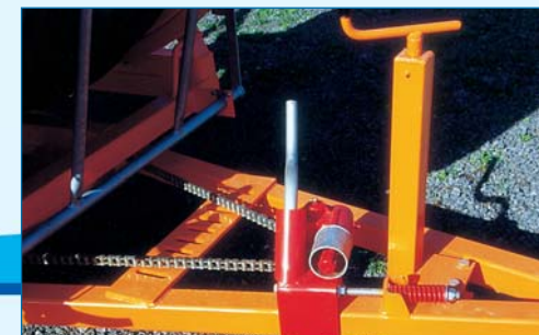
Rotation tourelle et cric mécanique