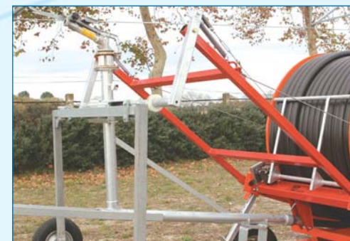
Accrochage automatique en fin d'arrosage