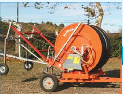
Relevage traîneau manuel par treuil