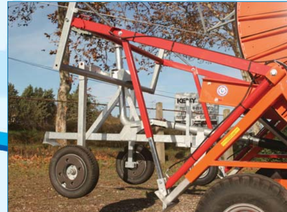
Relevage traîneau et bêtes