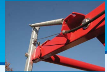
Système d'arrêt traîneau