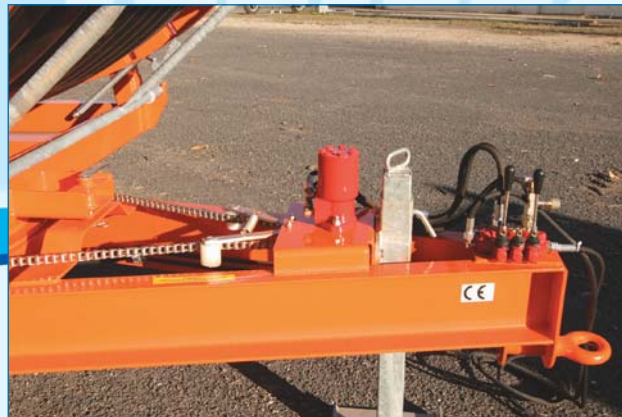
Rotation tourelle hydraulique