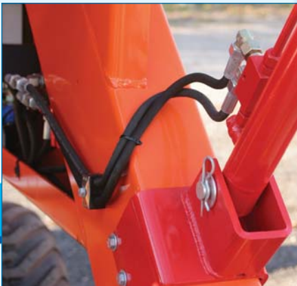
Relevage bêtes et traîneau